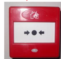
Pilt 5 Tulekahju teatenupp