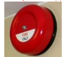
Pilt 6 Alarmseade