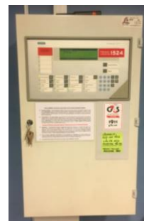
Pilt 3 ATS keskseade

ATS süsteemi tuleb regulaarselt kontrollida ja hooldada. Kontrolli ja hoolduse teostused märgitakse päevikusse. Päevikut täidavad nii kasutaja kui ka hooldusfirma. Kõikidest häiretest ja riketest tuleb teha sissekanne päevikusse. Sissekandest peab selguma, mis oli häire või rikke põhjus ja mis võeti ette.