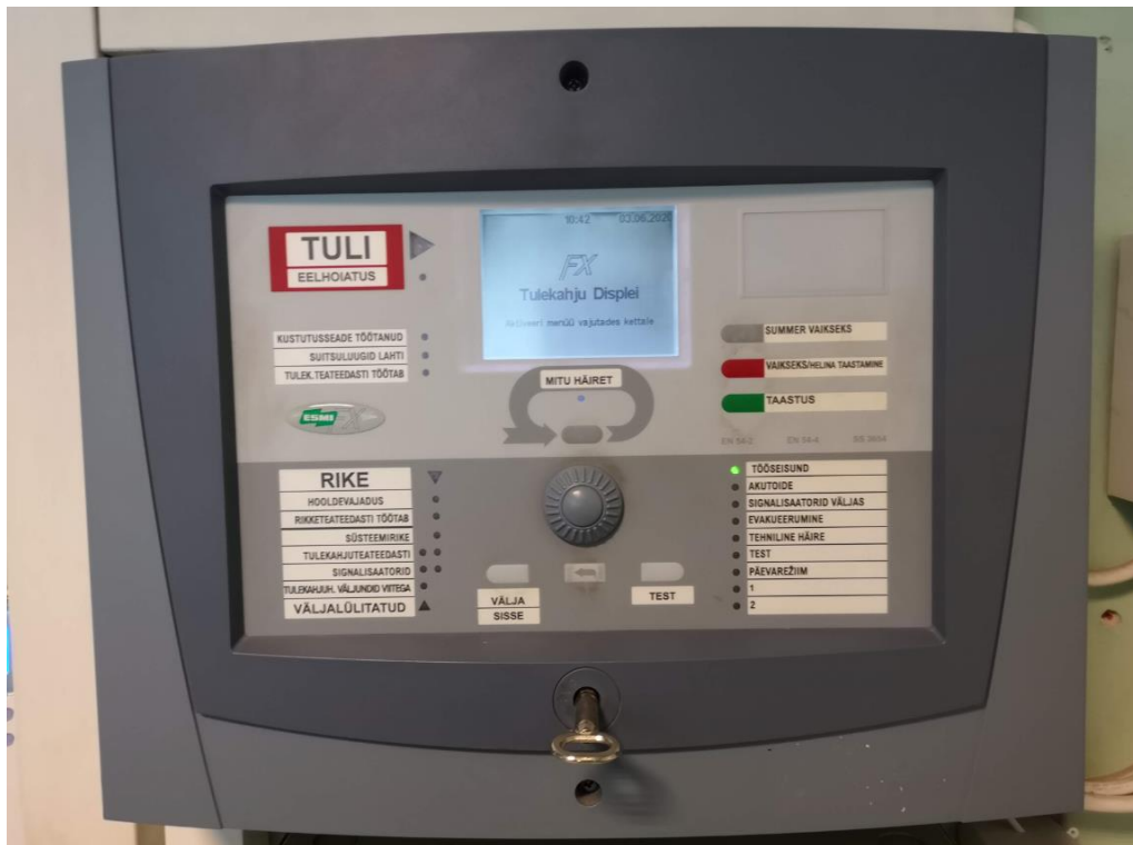
Foto. Hoone ATS keskseade.

2.9.2 Häire kuvatakse keskseadme paneelile. Paiknemisskeemid, kasutusjuhendid ja hoolduspäevikud asuvad keskseadme juures, mis asub fuajees administraatori ruumis.