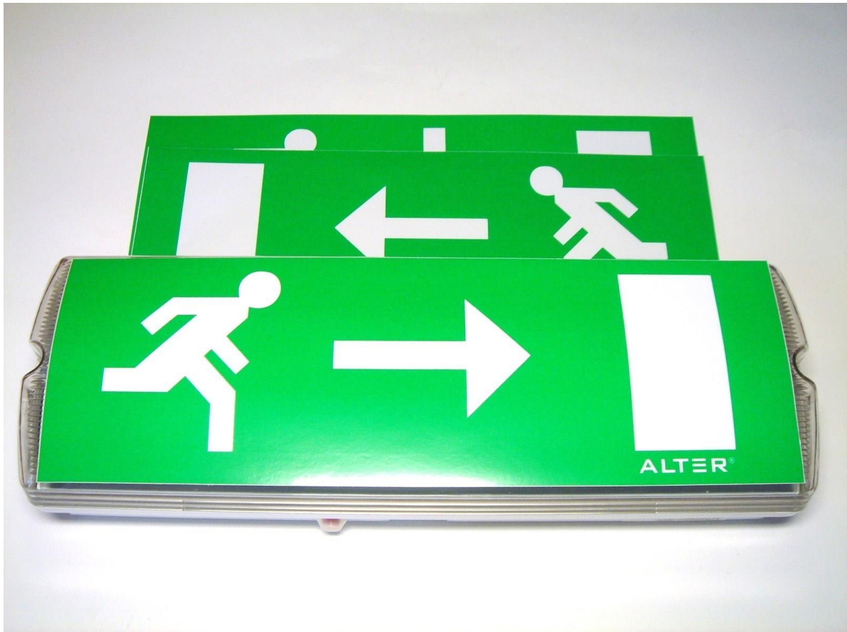
Foto. Evakuatsiooni märgistus (väljapääs noolega näidatud suunas) näidis.

2.7.1 Kõik evakuatsiooniteed ja -pääsud on tähistatud evakuatsioonimärgistustega.