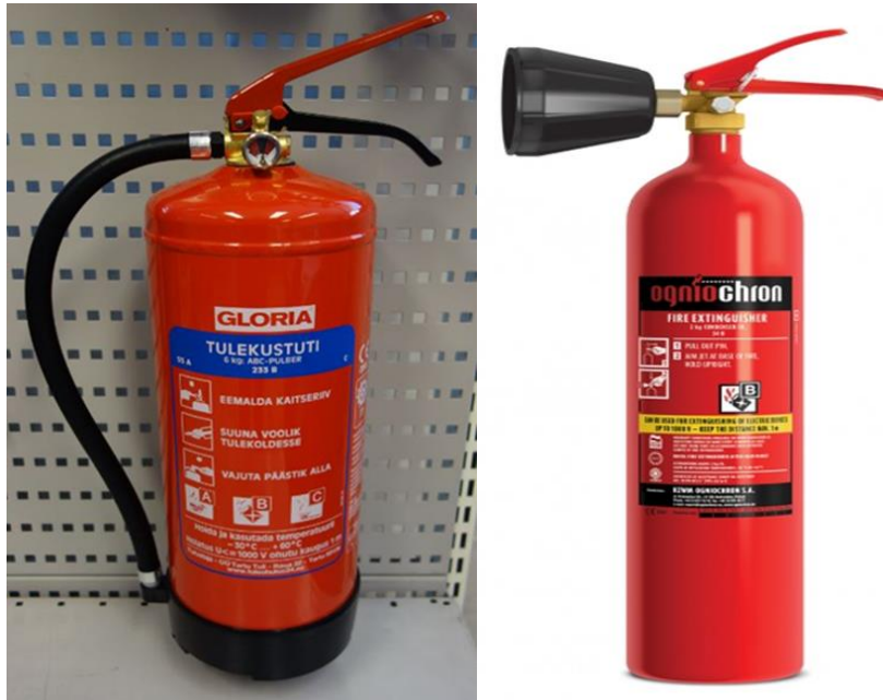
Foto. 6 kg ABC-pulberkustuti ja 2 kg süsihappegaaskustuti näidis.

2.8.1 Hoones on 6 kg ABC-pulberkustutid ja 2 kg süsihappegaaskustutid (CO 2 ).