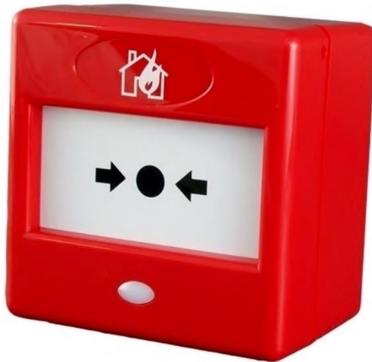
Foto. Tulekahju teatenupp näidis.