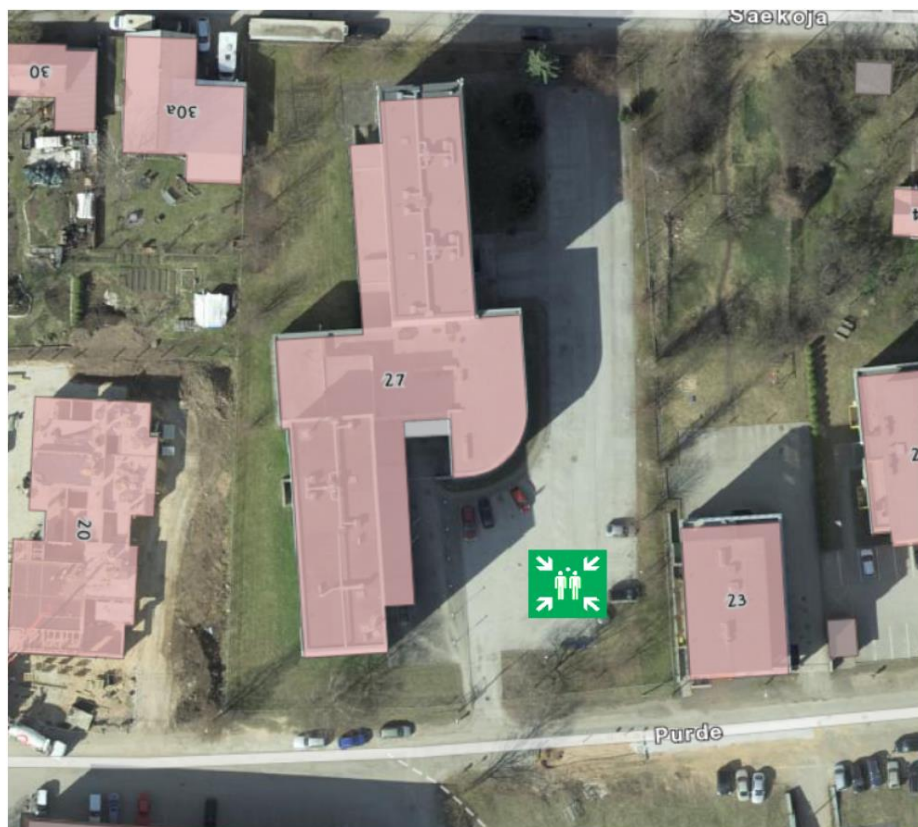
Foto. Hoone evakuatsioonijärgne kogunemiskoht

3.1.3 Hoonest väljudes tuleb koguneda koheselt kogunemiskohta. Kogunemiskoht asub Hoone autoparklas. Juhul, kui kogunemiskoht on kujunenud inimestele ohtlikuks, määrab evakuatsioonijuhut uue kogunemiskoha.