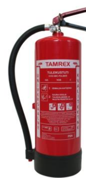
Pilt 1 6 kg pulberkustuti

Süsihappegaas-kustuti kustutab A, B ja C klassi tulekahjusid ning võib kasutada kuni 1000V pingega elektrijuhtmete ja -seadmete tulekahjude kustutamiseks. Süsihappegaaskustuti ei ole nii efektiivne kui pulberkustuti, kuid tema eelis pulberkustuti ees on vähene ümbruskonna saaste teke. Samuti kasutatakse süsihappegaaskustutite peenelektronika kustutamiseks, kuna süsihappegaas ei kahjusta samas ruumis olevaid elektroonikaseadmeid.