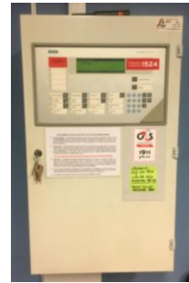
Pilt 3 ATS keskseade

ATS süsteemi tuleb regulaarselt kontrollida ja hooldada. Kontrolli ja hoolduse teostused märgitakse päevikusse. Päevikut täidavad nii kasutaja kui ka hooldusfirma. Kõikidest häiretest ja rikest tuleb teha sissekanne päevikusse. Sissekandest peab selguma, mis oli häire või rikke põhjus ja mis võeti ette.