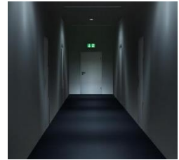
Pilt 7.1 Paanikavältimis- valgustus

Turvavalgusteid tuleb regulaarselt kontrollida ja hooldada . Kontrolli ja hoolduse teostused märgitakse päevikusse. Päevikut täidavad nii kasutaja kui ka hooldusfirma. Kõikidest riketest tuleb teha sissekanne päevikusse. Sissekandest peab selguma, mis oli rikke põhjus ja mis võeti ette.