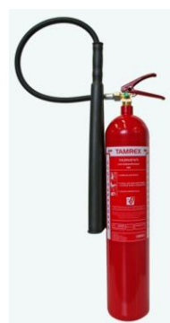
Pilt 1.1 2 kg süsihappegaas-kustuti