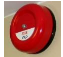
Pilt 6 Alarmseade