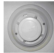
Pilt 4 Tulekahjuandur