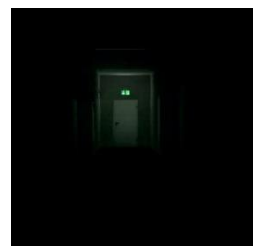
Pilt 7 Evakuatsiooni- valgustus

Evakuatsioonivalgustid (pilt 7) - elektritoite kadumisel jäävad evakuatsioonipääsude kohal olevad konkreetsele uksele viitavad valgustid põlema. Nende uste kaudu jõuab hoonest välja.