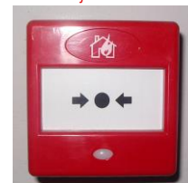
Pilt 5 Tulekahju teatenupp