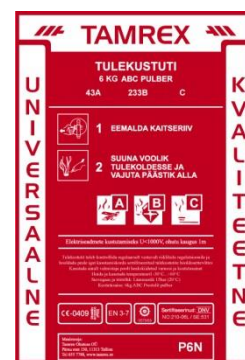
Pilt 1.2 pulberkustuti pealdis