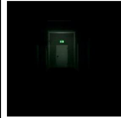
Pilt 7 Evakuatsiooni- valgustus

Turvavalgusteid tuleb regulaarselt kontrollida ja hooldada . Kontrolli ja hoolduse teostused märgitakse päevikusse. Päevikut täidavad nii kasutaja kui ka hooldusfirma. Kõikidest rikest tuleb teha sissekanne päevikusse. Sissekandest peab selguma, mis oli rikke põhjus ja mis võeti ette.