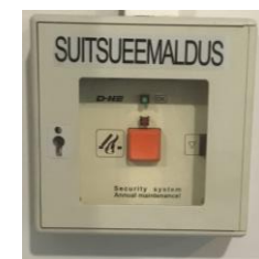
Pilt 8 juhtimisnupp ja suitsuluugid